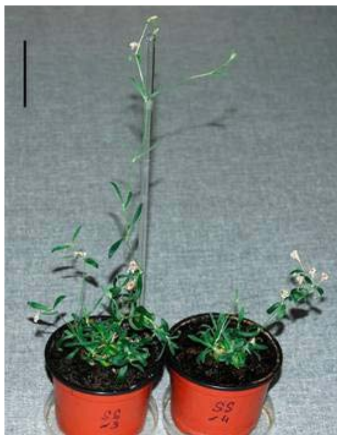
Silene stenophylla fait partie de la famille des Caryophyllacées (sur la photo, la barre représente 50 mm).

Trois différences phénotypiques ou physiologiques sont notables. Le spécimen moderne se développe plus rapidement et produit moins de bourgeons. Les pétales portés par les fleurs sont aussi plus larges.