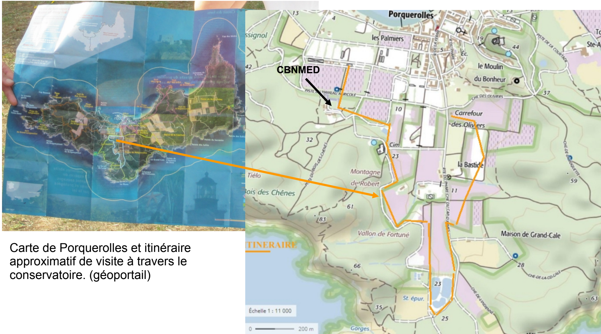
Carte de Porquerolles et itinéraire approximatif de visite à travers le conservatoire.

Porquerolles a une structure géologique en « toile ondulée », avec 4 plaines cultivées dans les creux, séparées par des reliefs. L'ensemble est en pente du sud vers le nord. Les vergers et vignobles de ces plaines constituent de bons coupes feux. Les vergers du conservatoire occupent 17 ha dans la plaine du village. Les principales espèces concernées sont : l'olivier, le figuier, le mûrier blanc et le dattier.