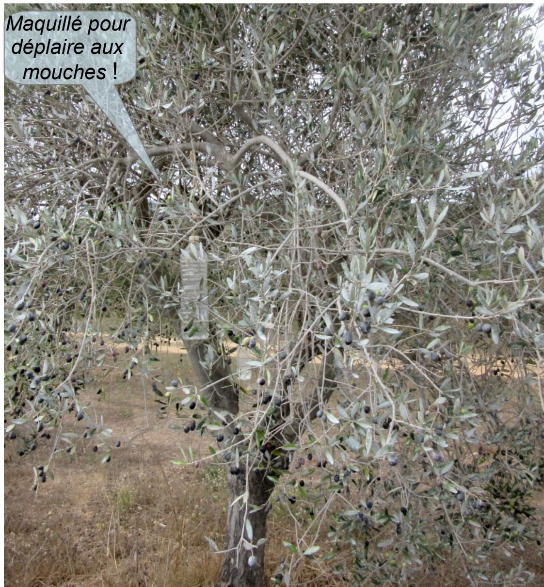
Caillotier de Nice enduit de kaolin et portant un piège