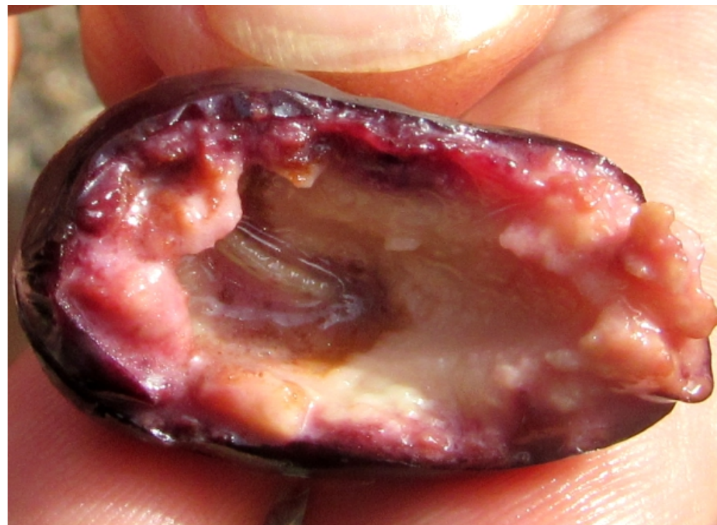
Larve de mouche

L'un des principaux ravageur des olives est la mouche de l'olivier : le diptère Blastocera oleae .