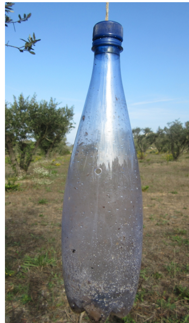
Piège attractif pour mouche de l'olivier

Les méthodes de protection possibles sont physiques chimiques ou biologiques. Le traitement à l'argile blanche (kaolin) a un effet masquant pour la mouche. Les bouteilles suspendues et trouées contiennent un produit attractif : le phosphate diammonium.