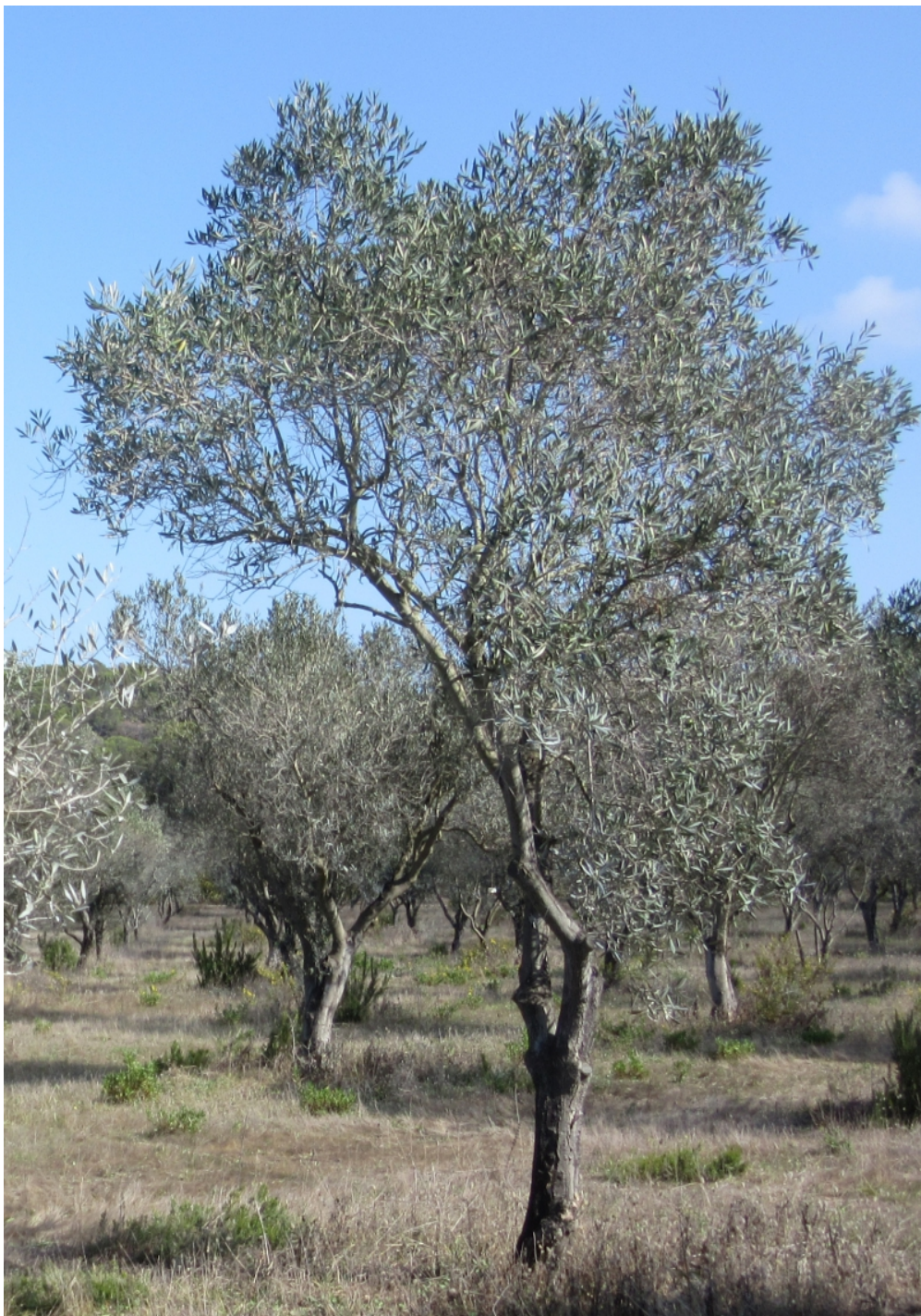
Oliviers laissés en croissance libre

Le conservatoire abrite 200 variétés d'oliviers dont 62 variétés de « terroir » et 98 variétés d'oléastres.