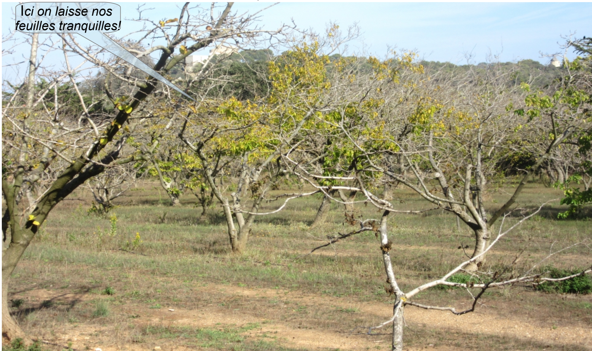
Verger de mûriers blancs

Les mûriers blancs ( Morus alba ) étaient largement cultivés en Provence et dans les Cévennes pour l'élevage des vers à soie.