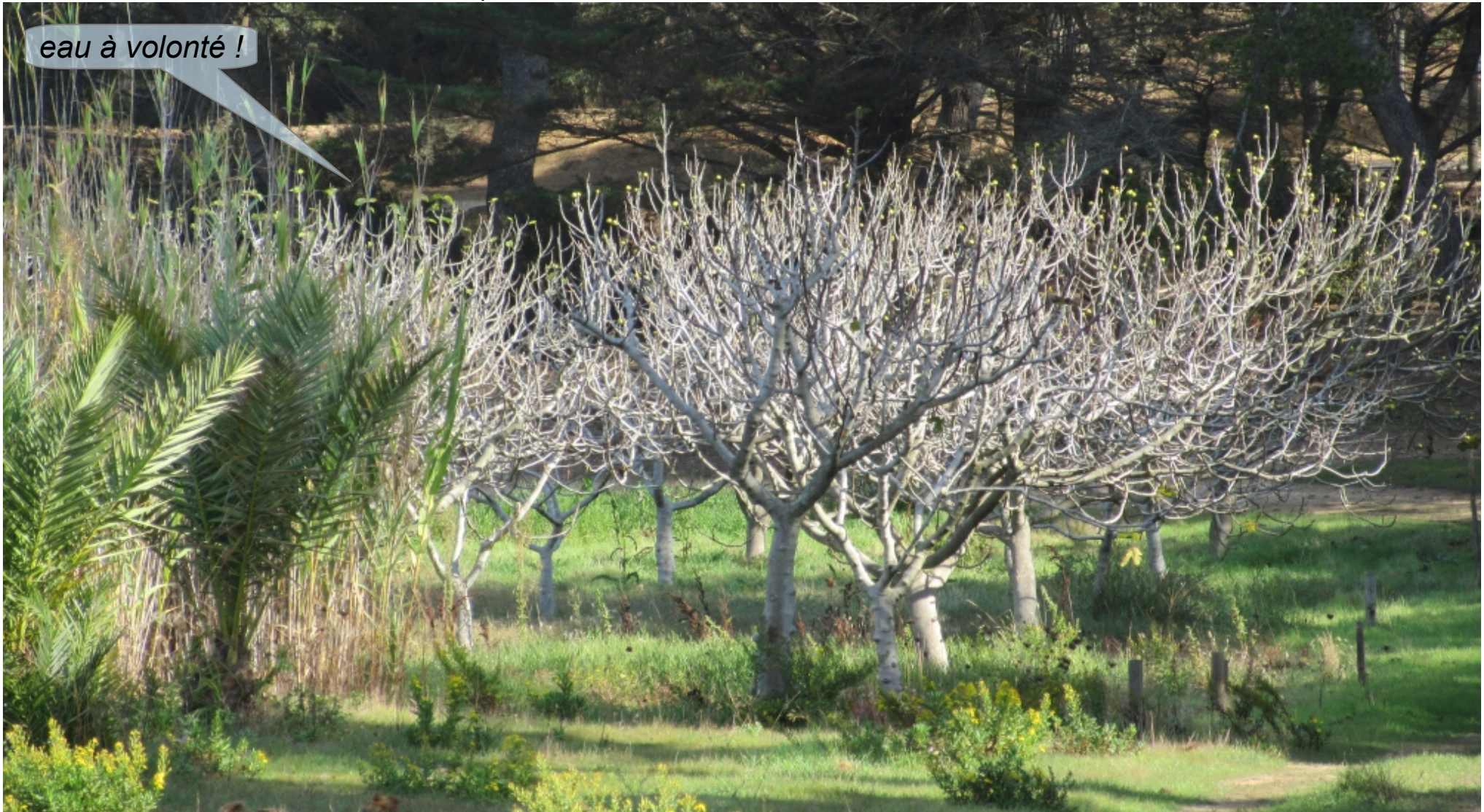
Dattiers et figuiers irrigués

Les figuiers ( Ficus carica ), dattiers ( Phoenix dactylifera ) et mûriers sont irrigués au goutte à goutte. Le conservatoire abrite 269 génotypes de figuiers et 70 variétés marocaines de dattiers. Les dattiers proviennent de cultures marocaines contaminés par une maladie cryptogamique : la fusariose. L'obtention s'est faite à partir de cultures de méristèmes (extrémité de bourgeon) naturellement indemnes de parasites.