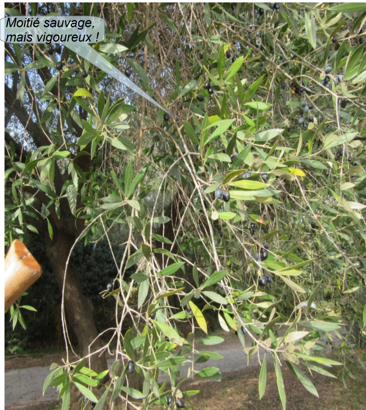
Olivier féral à port pleureur et petites olives, opinel pour échelle

Les oliviers issus de germinations spontanées « s'ensauvent ». Ils sont appelés oliviers « féraux ». Le port est ici pleureur et les olives de petite taille. La détermination des variétés fait appel à des critères anatomiques : forme des noyaux, des feuilles... Mais aussi des critères génétiques.