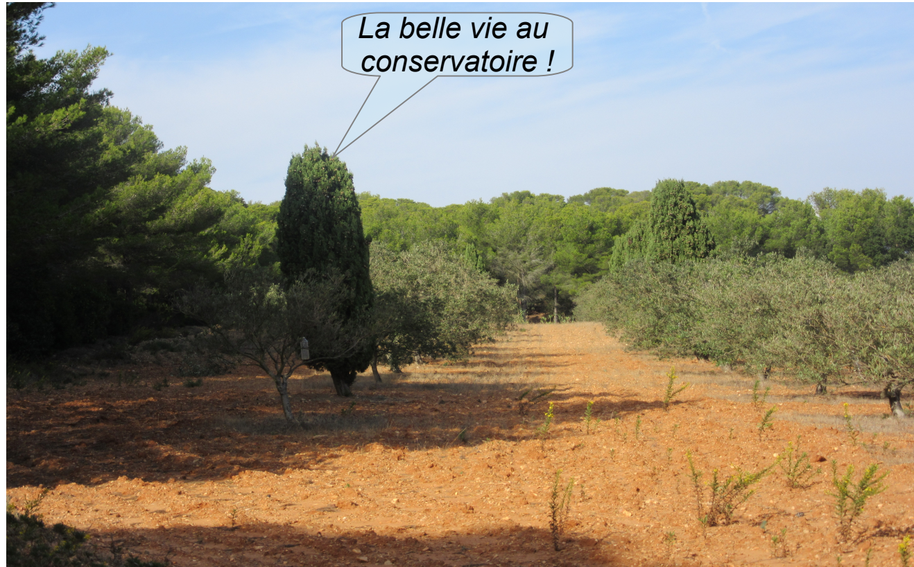
Paysage de Cézanne