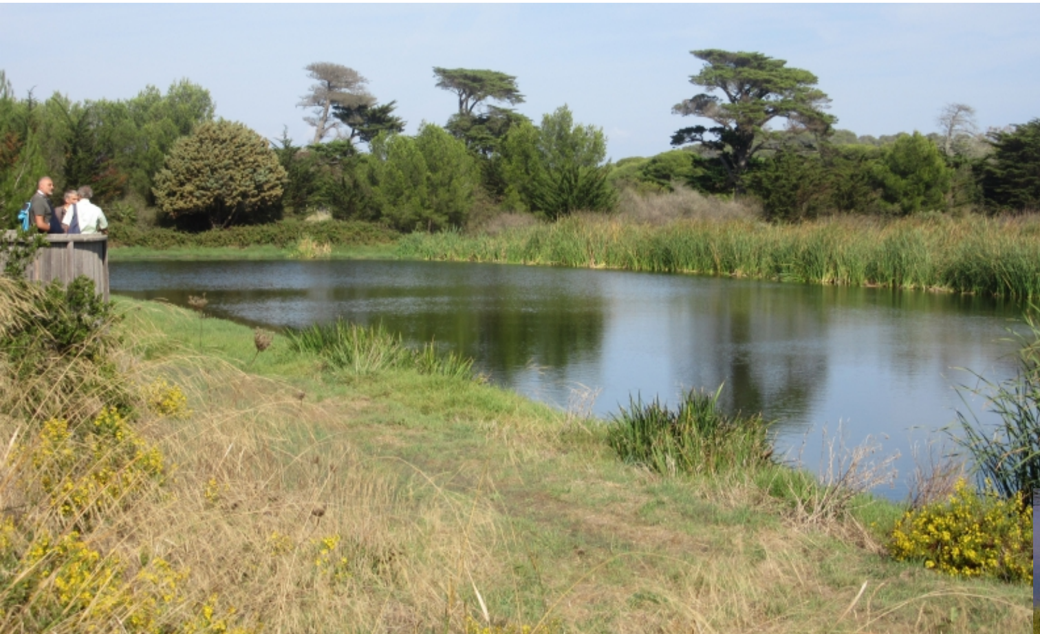
Bassin de lagunage

Dans le conservatoire, il y a un forage et un grand bassin. Les besoins d'irrigation sont aussi couverts par l'eau rejetée de la station d'épuration. La qualité de cette eau est compatible avec le rejet en mer mais pas avec l'usage agricole. Trois bassins de lagunage amènent cette eau à la qualité requise grâce à l'activité des microorganismes associés aux roseaux : minéralisation des substances azotées et élimination des nitrates.