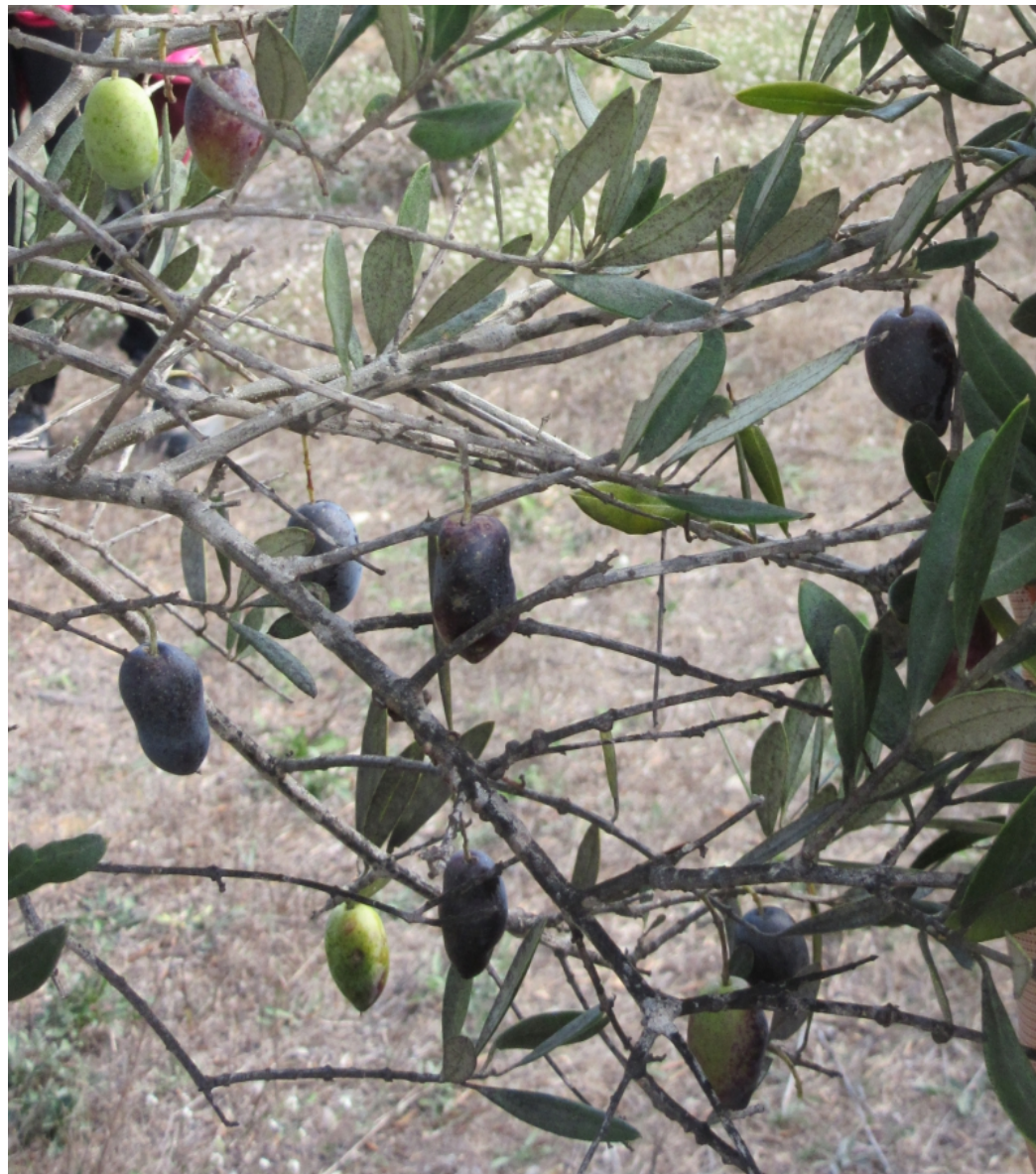
La Lucques aux olives allongées (italienne?)