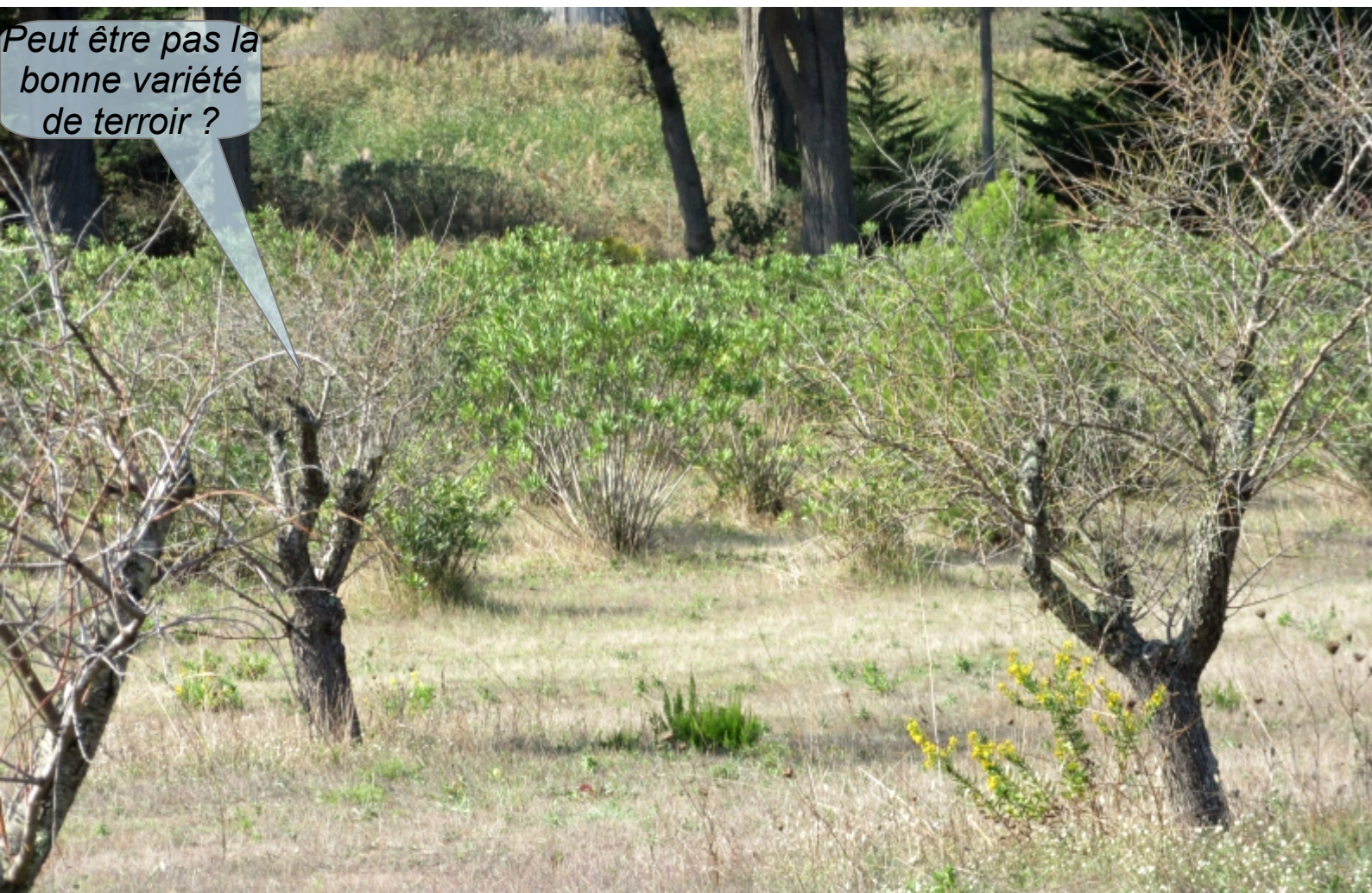
Amandiers et lauriers roses

Les lauriers roses en arrière plan sont cultivés en vue de repeupler les berges de rivières. Les rivières sont périodiquement « recalibrées » suite aux crues... Ces intervention détruisent les peuplements de lauriers des berges.