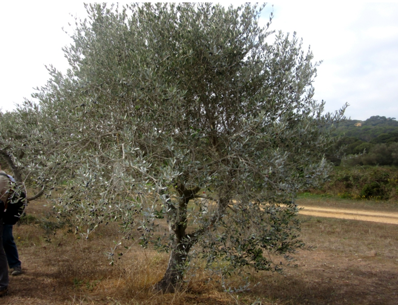
Caillotier de Nice taillé 4 ans auparavant par le CFPPA

Le Parc National confie en 2014 l'entretien des vergers à l'association « sauvegarde des forêts varoises » basée à Hyères : sauvegarde des forêts varoises