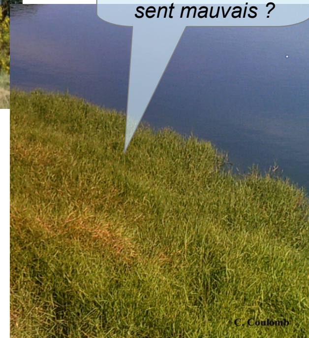
Paspalum distychem en bord de bassin

On pompe les nitrates et il paraît qu'on sent mauvais ?