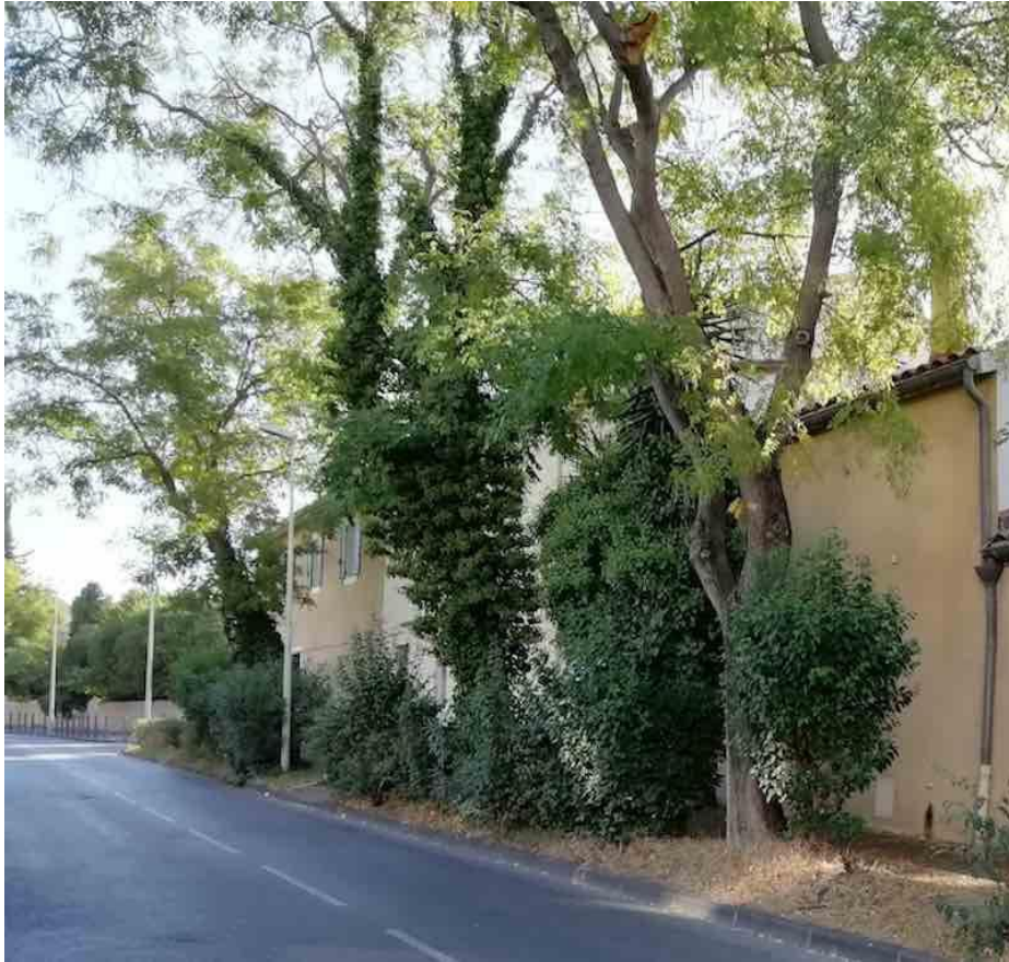
Sophora portant des lierres au printemps 2022.