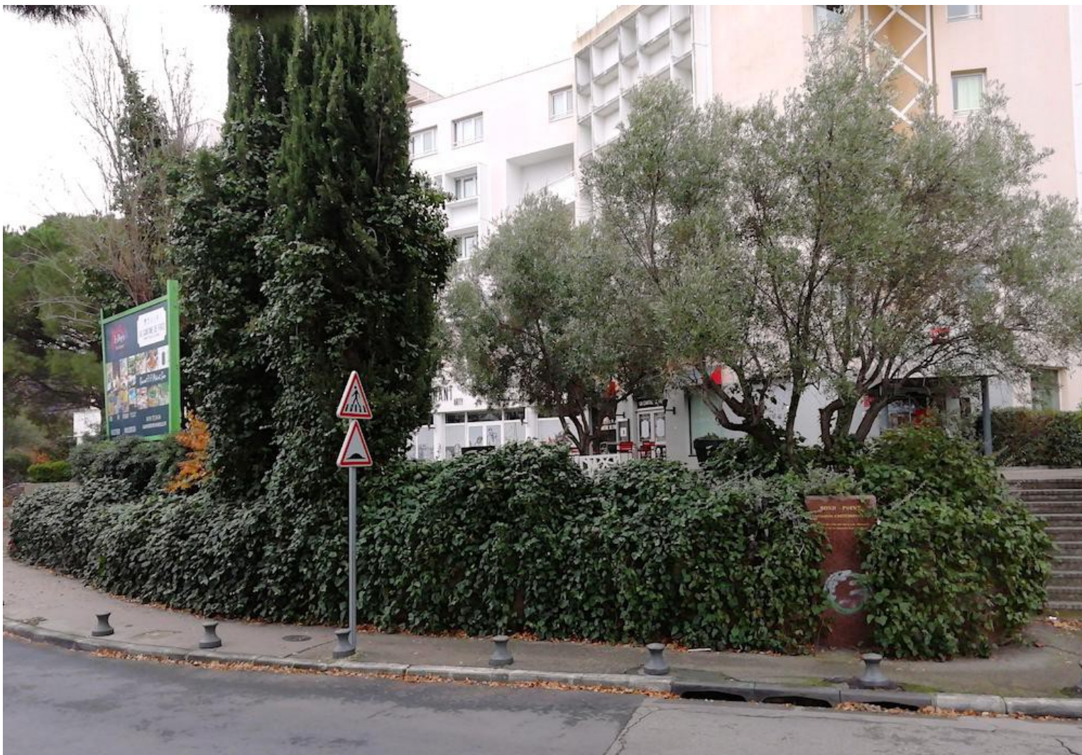
Ibis Bonneveine, Marseille