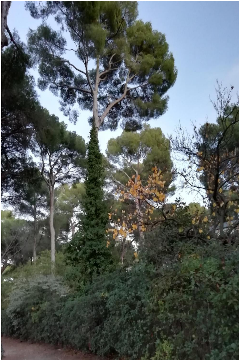
Roi d'Espagne, Marseille