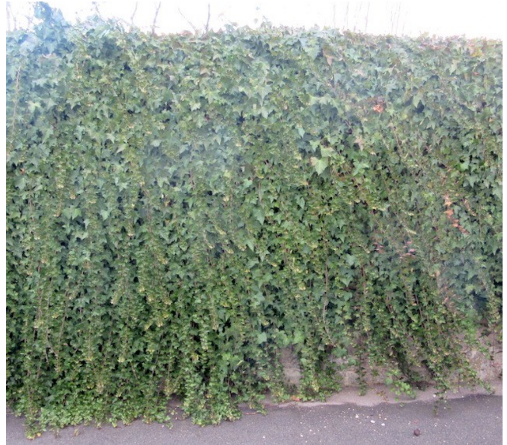
La Bédoule, Bouches du Rhône