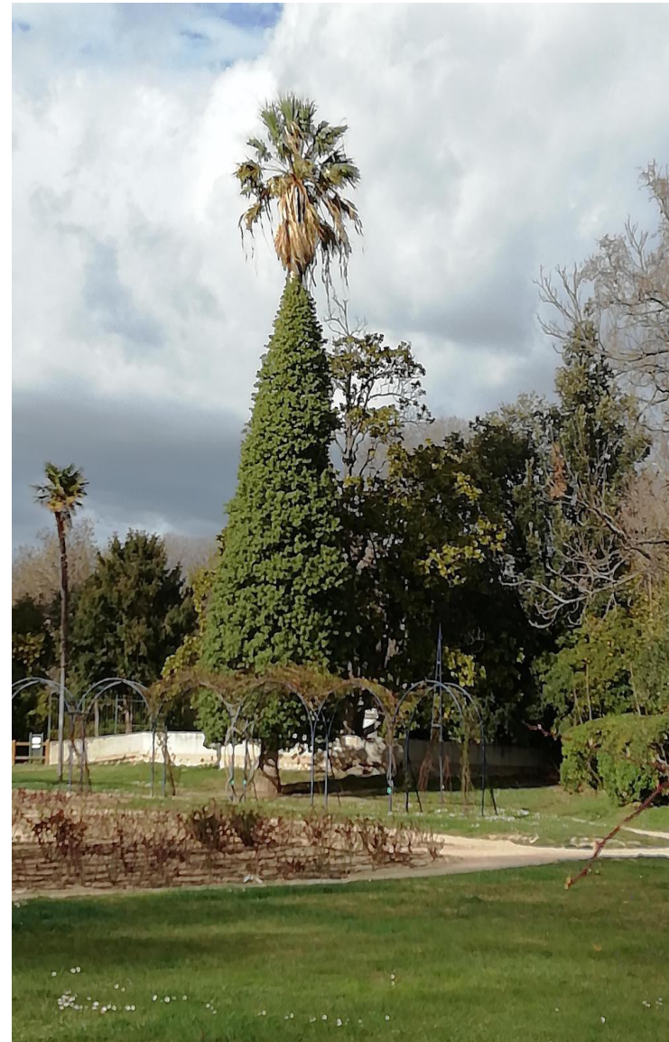
Parc Borély, Marseille

-Formation de jupes vertes sur les hauts futs de conifères ou palmiers