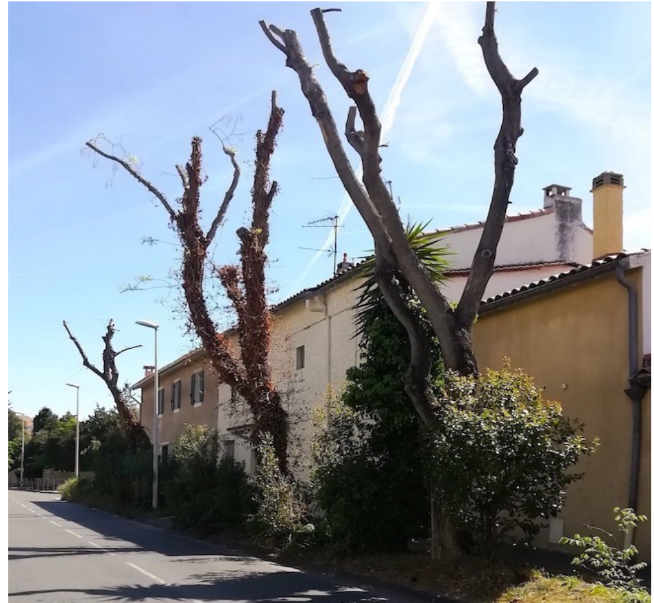
Les mêmes Sophora à l'hiver 2023 après élagage des arbres et éradication des lierres.

- La réputation des lierres ( Hedera helix ) est contrastée, souvent mauvaise elle conduit à leur élimination..