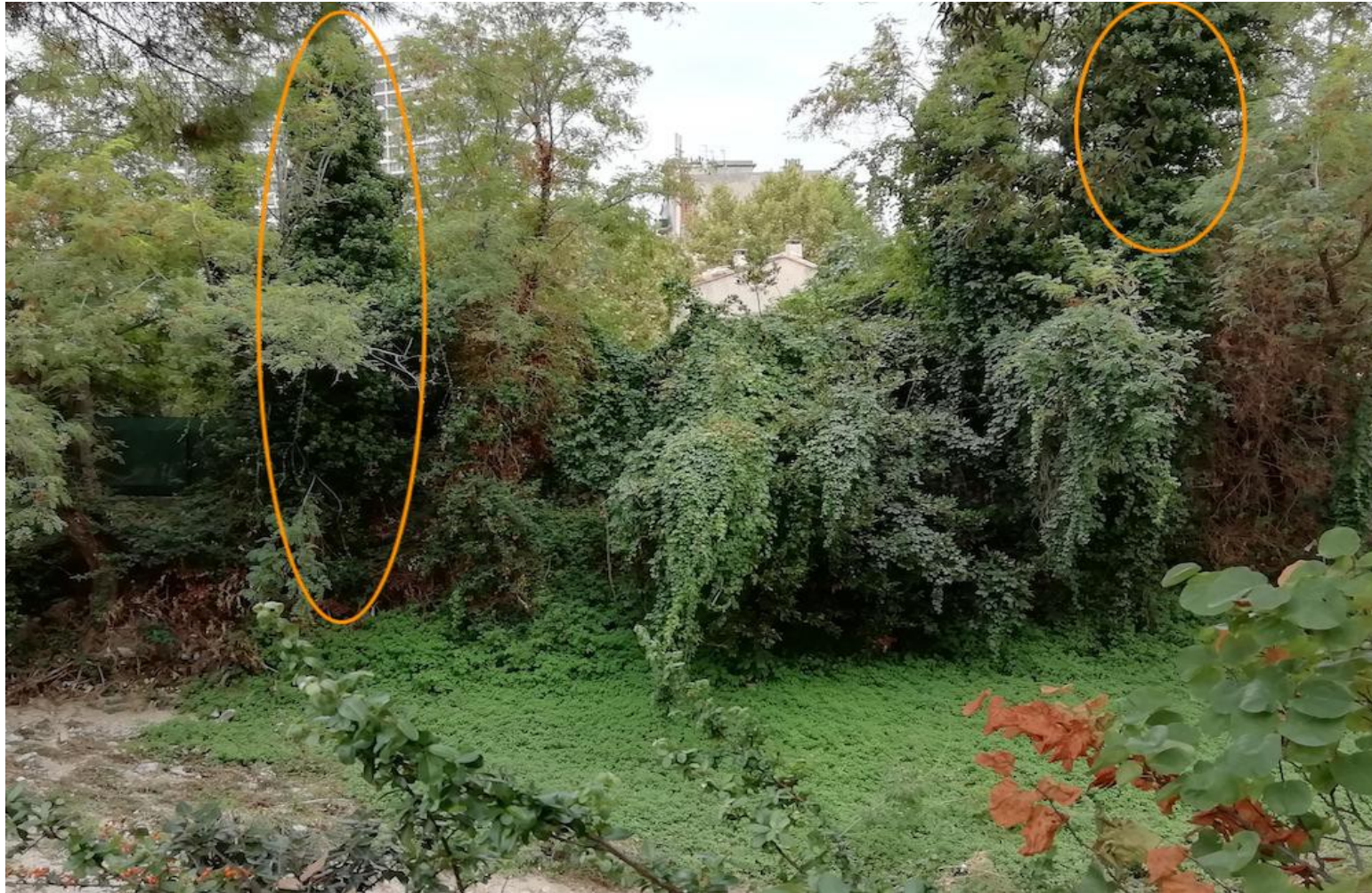
Bord d'Huveaune, Marseille

- Développement des lierres arboricoles (ellipses) raisonnable en regard de grimpantes comme les vignes vierges.