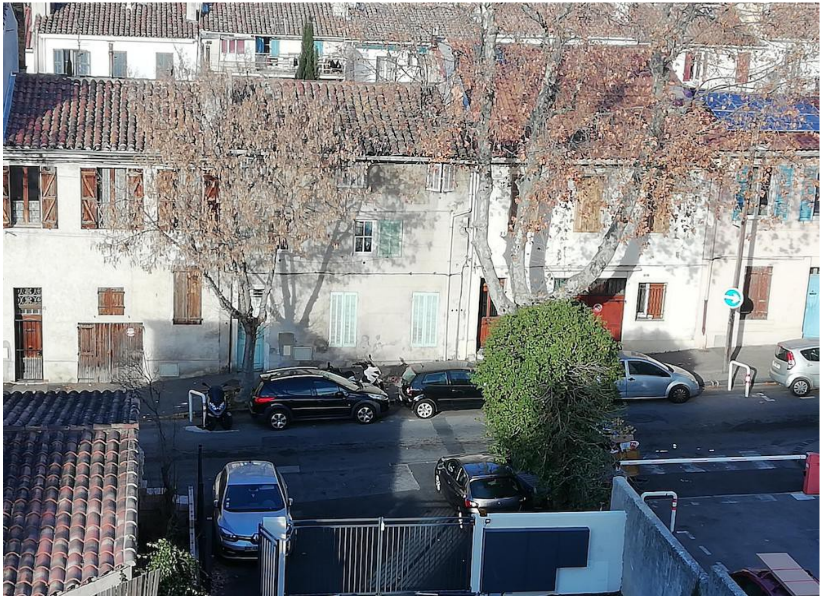
Saint Barthélemy, Marseille